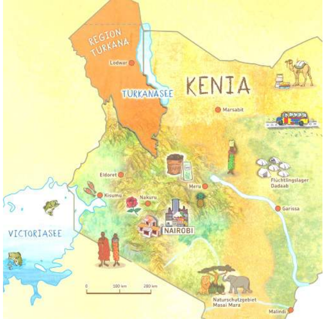
Keniakarte der Sternsinger